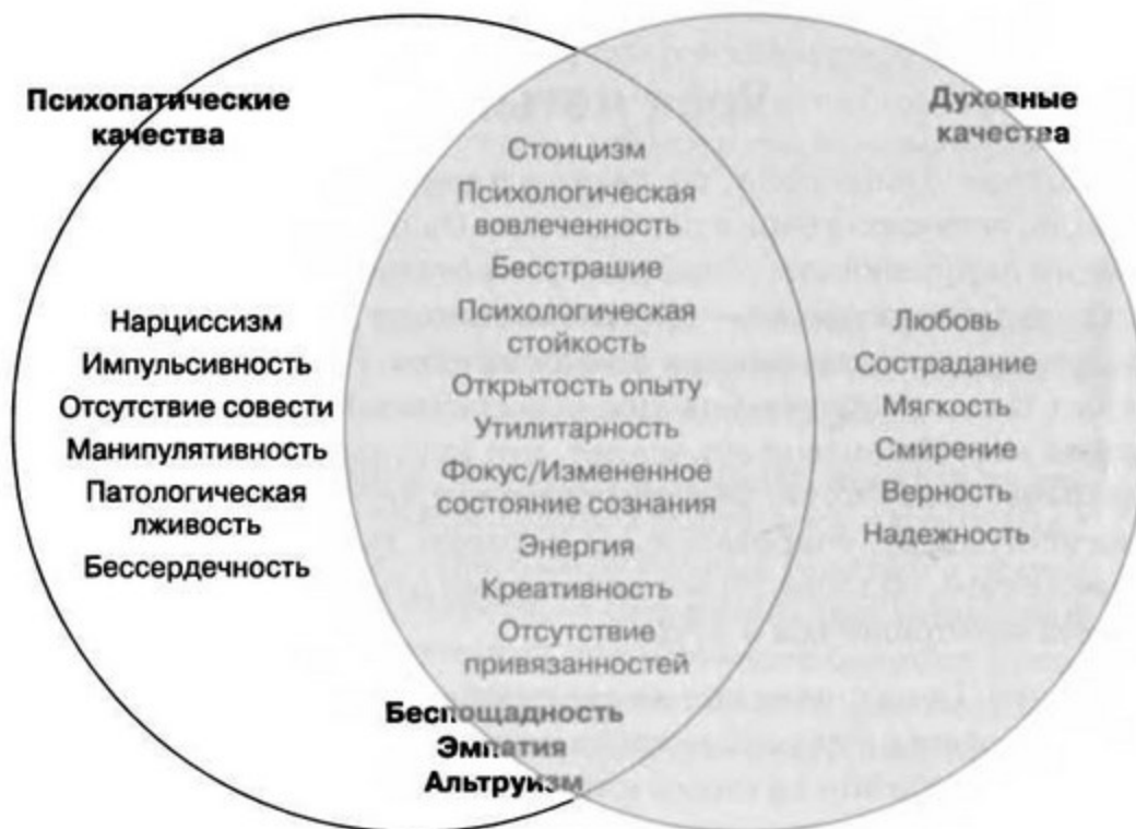
Рис. 7.2. Связь между психопатическими и духовными качествами

Закончив с делами, связанными с агентом ФБР из Куантико, я отправился отдохнуть на юг, во Флориду. Убивая время в Майами в ожидании обратного рейса, безоблачным воскресным утром я случайно оказался в Малой Гаване, на блошином рынке. На столике с антикварными вещицами, рядом с лобзиками, лежал экземпляр «Арчи и Мехитабель» — ее запыленная темносиняя обложка сверкала как бирюза под тропическим солнцем.