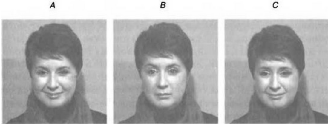
Рис. 4.1. На рис. А изображена искренняя улыбка, на рис. С — фальшивая с примесью печали (опущенные брови, веки и уголки рта). На рис. В изображено нейтральное выражение лица. Даже такие мельчайшие и мимолетные изменения способны изменить все лицо целиком

Портеру было интересно, окажутся ли участники, демонстрирующие более высокий уровень психопатии, более искусственными в сокрытии истинной природы своих чувств, чем добровольцы с низким уровнем психопатии.