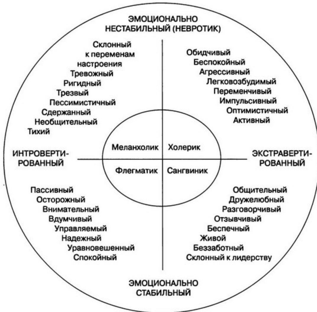
Рис. 2.2. Модель личности Айзенка, включающая в себя четыре темперамента Гиппократа (Eysenck & Eysenck, 1958)

расположенные на перпендикулярных осях, идеально описывали четыре классических темперамента, сходно выделенных Гиппократом (рис. 2.2).