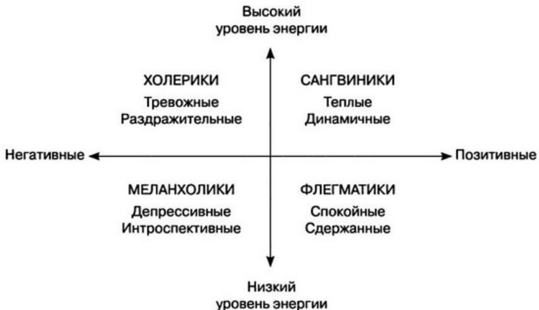
Рис. 2.1. Четыре темперамента по Гиппократу

Личность имеет долгую историю. Или скорее долгую историю имеет измерение личности. Оно было начато в Древней Греции Гиппократом (460–377 гг. до н. э.), отцом западной медицины. Опираясь на мудрость более ранних школ (например, вычисления хода светил в вавилонской астрологии, которая попала в Средиземноморье вместе со сказаниями Древнего Египта и мистическими учениями Месопотамии), Гиппократ выделил четыре различных темперамента в зависимости от проявления эмоций: сангвиники, холерики, меланхолики и флегматики.