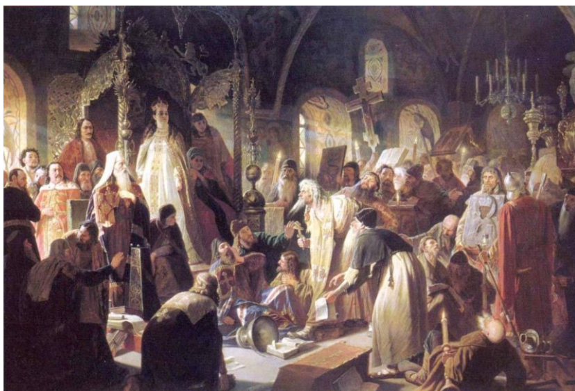
В.Г.Перов “Спор о вере”

Всё это, относящееся к историческому периоду испытаний на истинность библейской культуры, нашло выражение в творчестве русских художников. И этот процесс, по нашему мнению, хорошо иллюстрирует следующий видеоряд: