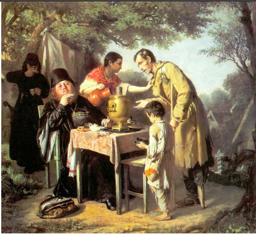
В.Г.Перов “Чаепитие в Мытищах”