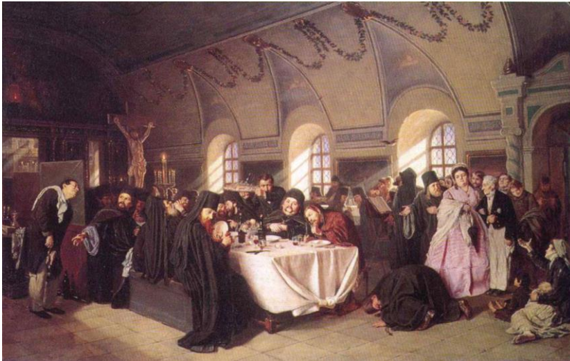
В.Г.Перов “Монастырская трапеза” 1