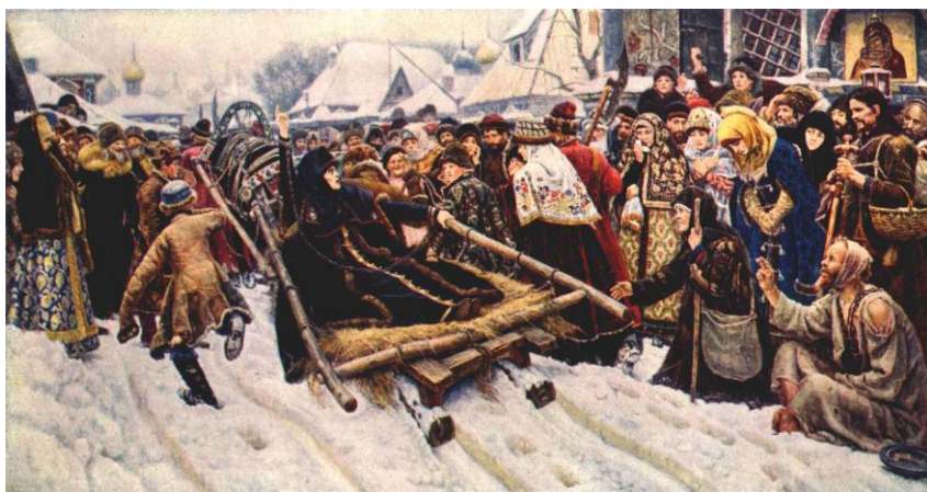
В.И.Суриков “Боярыня Морозова”