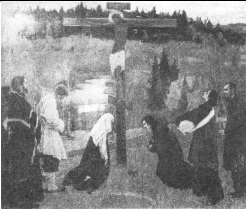
М.В.Нестеров “У креста”

А вообразите, что действительно «Христосик нашёлся», т.е. в реальности происходит второе пришествие, что тогда? — Тогда они с такой верой и отношением к жизни проследуют по пути порицаемого ими иудейского синедриона начала эры и в самой пошлой форме повторят его приговор. Ни к чему иному они не способны, пока пребывают в самоослеплении нехристианской, апостольской 1 верой, унаследованной от Савла и его сподвижников, включая и отпавших от Христа в Гефсиманском саду других апостолов.