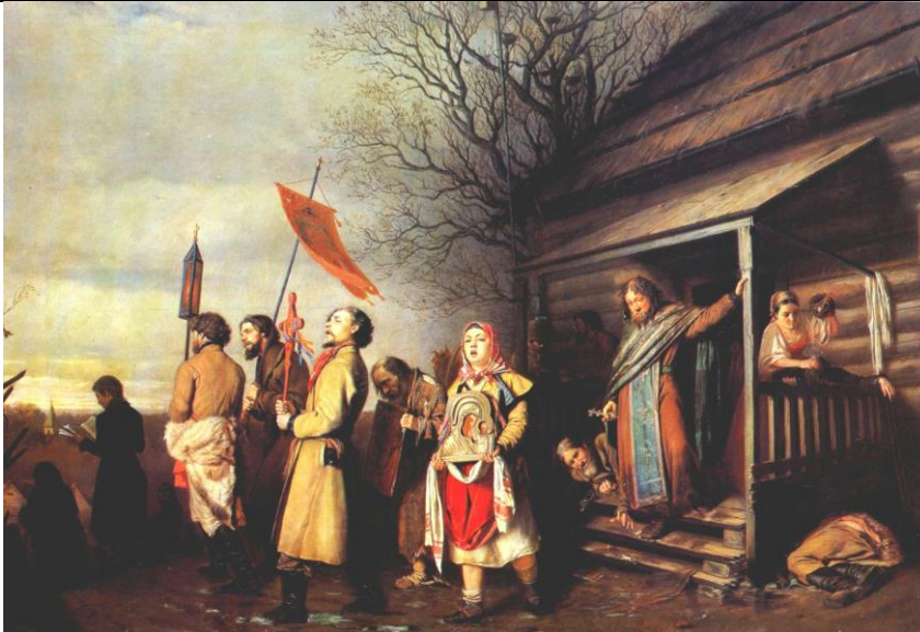
В.Г.Перов “Сельский крестный ход на Пасху”