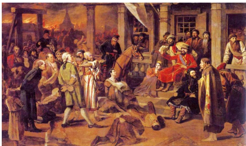
В.Г.Перов “Суд Пугачева”