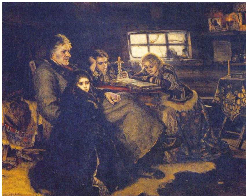
В.И.Суриков “Меншиков в ссылке в Березове”