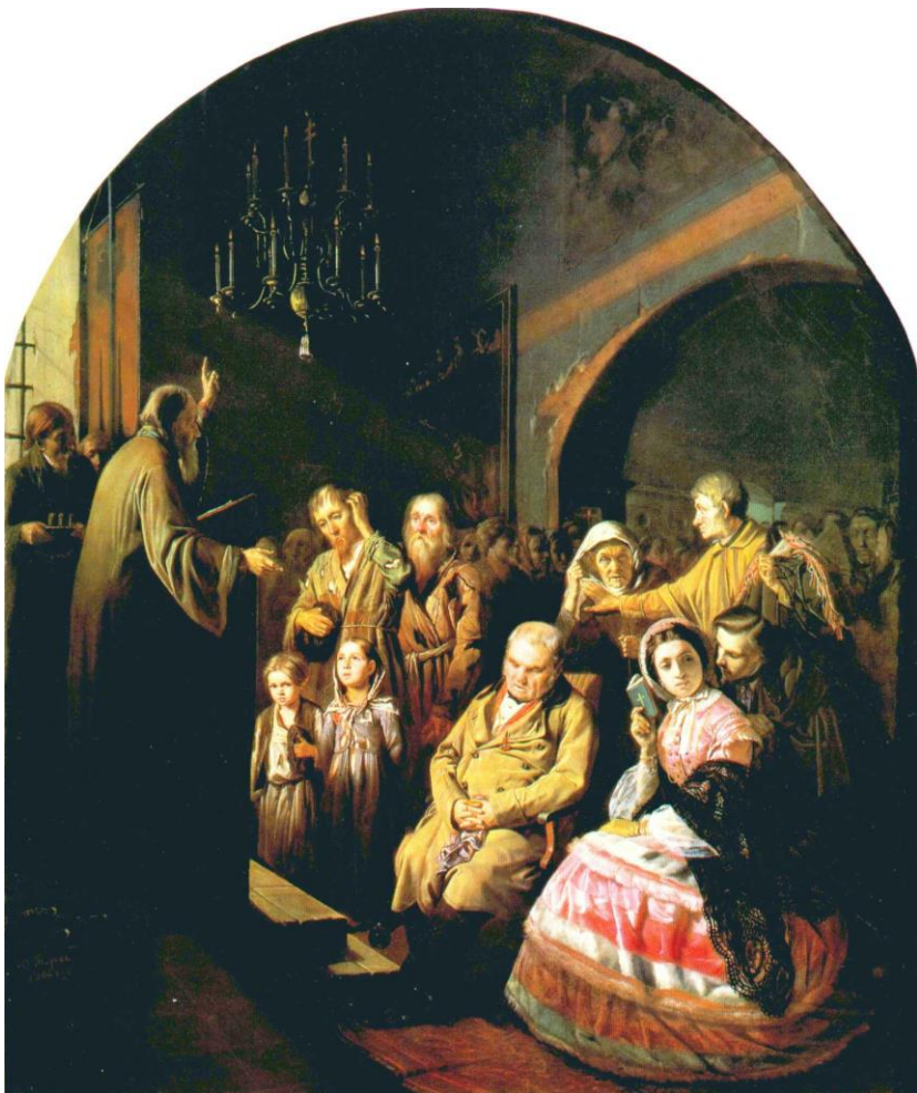
В.Г.Перов “В сельской церкви”

Из этого должно быть понятно, что так дальше жить было нельзя, вследствие чего библейская культура на Руси в 1917 г. рухнула. При этом было бы напраслиной возлагать на Советскую власть какую-то особую ответственность за искоренение из общества жизнеспособной веры. Как свидетельству-