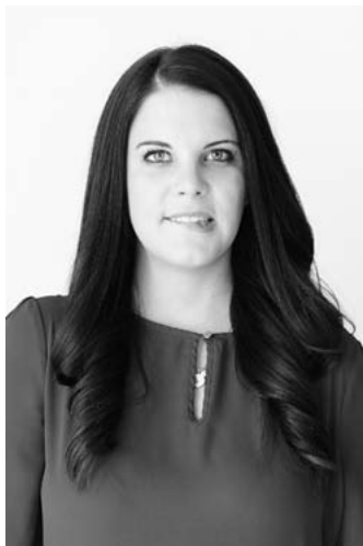
Прикусывание нижней губы

студента высказаться. Обычно я говорю что-нибудь сочувственное вроде: «Похоже, вы хотите что-то добавить к сказанному мной». Многие студенты удивляются моей способности читать их мысли и радуются тому, что я обращаю на них внимание.