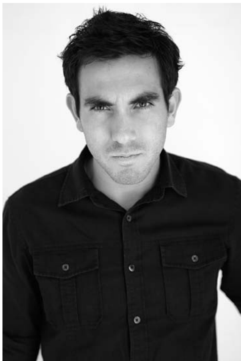
Сердитый городской взгляд

Скажите честно, захочется ли вам знакомиться с изображенным на фотографии человеком с сердитым, злобным взглядом? Заметьте, однако, что многие люди, носящие маску враждебности, делают это совершенно неосознанно. Они сами не понимают, что своим видом отпугивают окружающих. Именно поэтому так важно понимать, что представляют собой вербальные и невербальные дружелюбные сигналы.