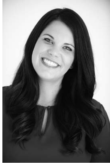
Наклон головы в сторону

Женщины склоняют голову в сторону чаще, чем мужчины. Мужчины же чаще общаются, держа голову прямо, чтобы подчеркнуть свое превосходство. В деловых отношениях такой жест дает некоторые преимущества, но в неформальном