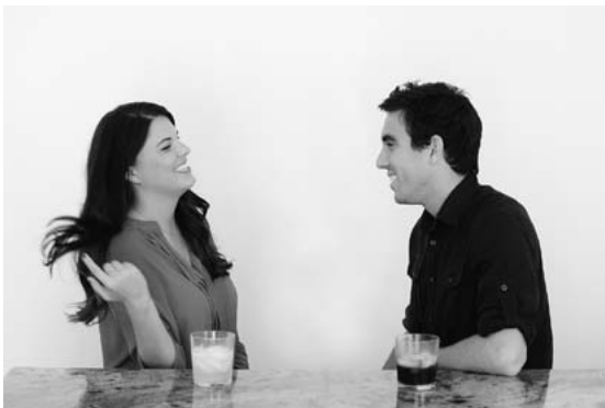
Последовательность движений при отбрасывании пряди волос