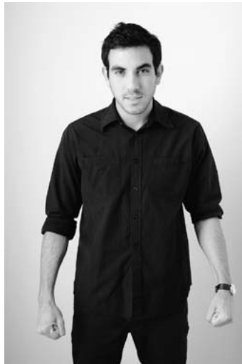
Поза готовности к нападению

Те, кто готов напасть, обычно демонстрируют такие невербальные сигналы, как сжатые кулаки и расставленные шире