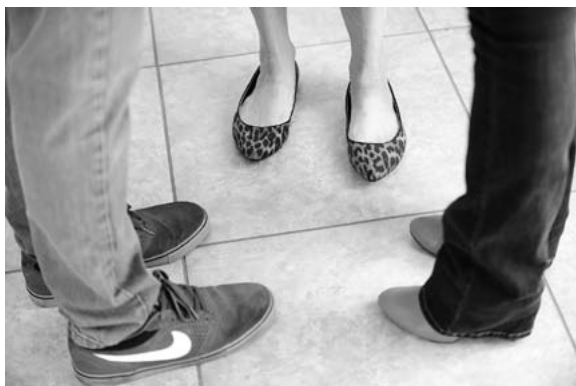
Ведется частный разговор: посторонним вход запрещен

Если вы видите, что три человека, беседуя, смотрят друг другу в лицо, а их ступни направлены внутрь замкнутого круга, это знак того, что новые собеседники здесь нежелательны. И напротив, если три человека разговаривают, глядя друг на друга, но стоят не замкнутым кругом, тем самым они сообщают окружающим, что готовы принять в свою компанию новых собеседников.