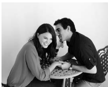
Постепенное установление взаимного доверия и тесного контакта