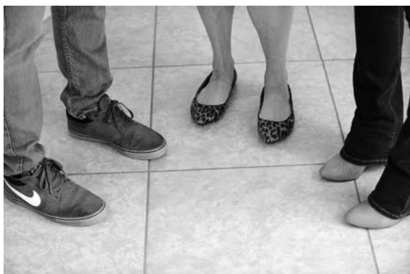
Члены группы стоят вольно, их ступни не направлены друг на друга и не образуют замкнутый круг. Значит, группа готова принять нового участника