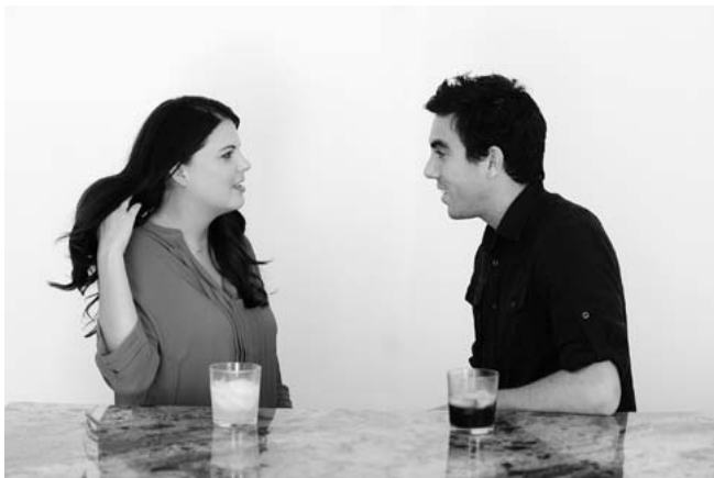
Отбрасывание пряди волос

Если партнер резко встряхивает головой, а затем отбрасывает со лба прядь волос, значит, между вами установилось взаимопонимание. При этом жесте происходит взаимный