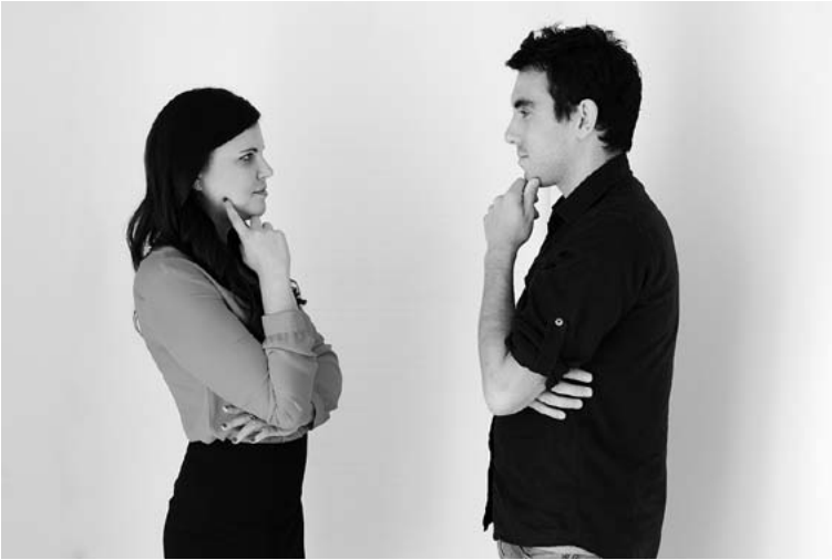
Изопраксия — подражание жестам собеседника

Собеседник не будет осознавать, что замечает ваше подражание, поскольку оно вписывается в стандарт человеческого поведения и мозг не воспринимает его как нечто необычное. Однако отсутствие подражательного поведения может расцениваться как сигнал враждебности, и мозг сразу отметит это. Возможно, человек, жесты которого собеседник не копирует, и сам не сумеет объяснить причину своего дискомфорта, но враждебный сигнал вызовет у него оборонительную реакцию, препятствующую установлению доверительных дружеских отношений.