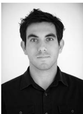
Неестественная игра бровями