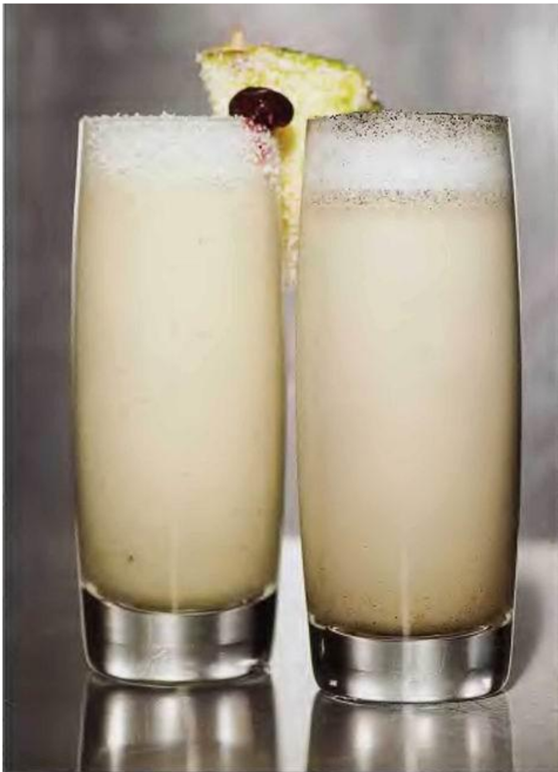
Из рецептов Чедда Сарно Миндальное молочко