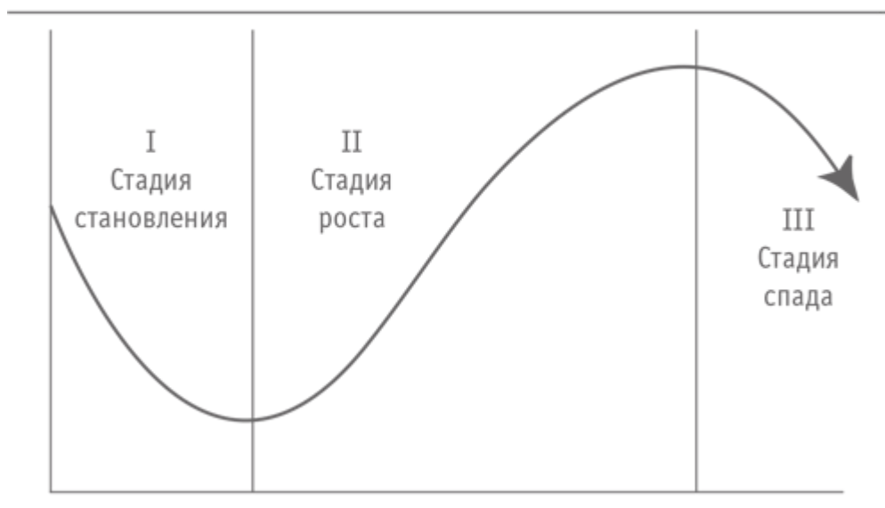
Рис. 7.1. Сигмоидальная (S-образная) кривая

Давайте более детально рассмотрим особенности каждой из указанных стадий. Первая из них, стадия становления, характеризуется высоким уровнем активности. Начиная делать карьеру или бизнес, вы открываете для себя различные возможности, сталкиваетесь с теми или иными проблемами, принимаетесь за реализацию новых инициатив (извлекая из этого соответствующие уроки), прилагаете массу усилий и тратите немало времени, чтобы достичь успеха в профессиональном и финансовом отношении. Большинству вновь открывающихся предприятий не удается преодолеть первую стадию. Чтобы выжить, им не хватает силы воли или ресурсов или же и того и другого вместе. Высокий процент неудач при создании новых